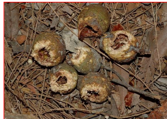
Marri noten aangevreten door Carnaby's Kaketoe