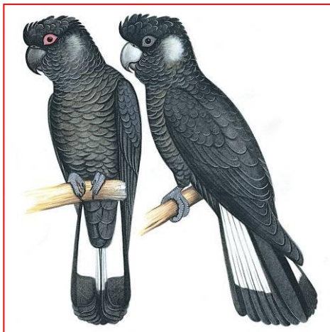
Mannetje (links), vrouwtje (rechts)