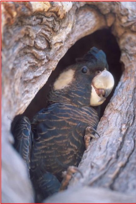
Vrouwlijk Carnaby's Kaketoe in het nest

bestaat uit bloemen, nectar en zaden van Banksia, Dryandra, Hakea, Eucalyptus, Corymbia, Grevillea, en ook zaden van Pinus, vruchten en noten bomen vooral amandelen en macadamias, en het vruchtvlees en het sap van appels en dadels en insecten larven